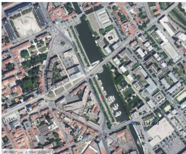
Darse Saint-Georges (port de plaisance actuel) et darse-Sainte Catherine, au nord