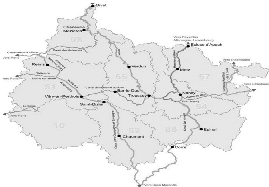
Carte du réseau de voies navigables en Grand-Est

Idéalement situé au carrefour fluvial entre la Moselle, le Canal des Vosges et le Canal de la Marne au Rhin, le port de Nancy Saint Georges était auparavant dédié à l'accueil des marchandises amenées par les péniches et autres activités de fret.